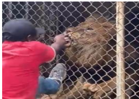
Imagen 4. Caso ataque. Zoológico Jamaica.