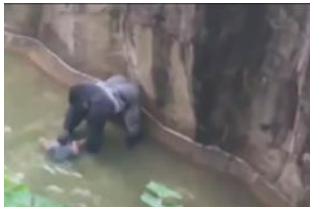
Imagen 2. Caso Harambe. Zoológico Cincinnati. EEUU.

También son recordados los casos del osezno polar Knut, orgullo del zoológico de Berlín, que falleció ahogado en una piscina en plena exhibición ante los humanos 2 , el horrible caso de Harambe, el gorila, quien fue asesinado a balazos por los cuidadores del zoológico de Cincinnati en Estados Unidos por el riesgo al que se expuso un niño, con la negligencia de sus padres, quien cayó al recinto de los gorilas 3 , el caso del león que arrancó los dedos de uno de los cuidadores en el zoológico Attractions de Jamaica 4 , el caso del Júpiter, el león que falleció en Cali después de padecer traslados injustificados de sitios donde no se garantizaba su bienestar 5 o el caso de Arturo, el último oso polar argentino, que murió en zoológico de Mendoza después de padecer de una serie de problemas, incluidos temas de pobre enriquecimiento, ausencia de bienestar y estrés térmico, entre otros, que motivaron el rechazo ciudadano y reabrieron el debate sobre si es ético o no mantener animales en cautiverio, entre muchos otros casos que se dan a diario en todo el mundo afectando a cientos de miles de animales.