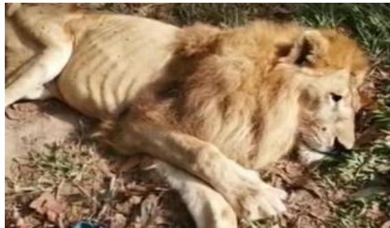
Imagen 3. Caso Júpiter. Cali, Colombia.