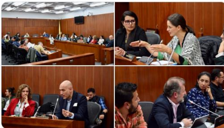
Imagen 7. Gran reunión con investigadores y trabajadores de zoológicos. Octubre 20 de 2022

A manera de recuento, de dichas mesas de trabajo a las que asistieron, entre otros, representantes del Acuario de Santa Marta, Parque Ukumarí, Parque Jaime Duque, Piscilago, ACOLAP, Universidad Nacional de Colombia, zoológico Santa Cruz, Fundación