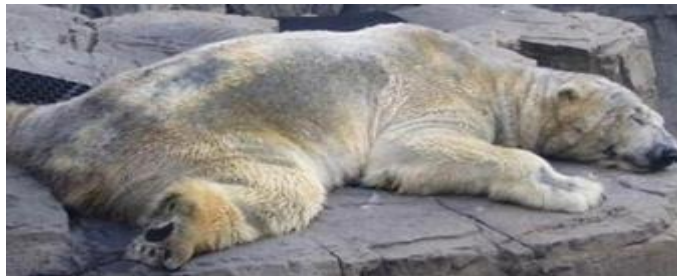
Imagen 4. Caso Arturo. Zoológico Mendoza, Argentina.