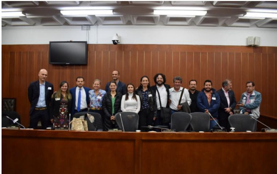
Imagen 6. Gran reunión con investigadores y trabajadores de zoológicos. Octubre 20 de 2022