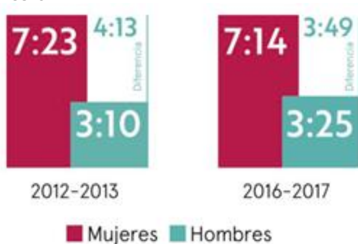
Gráfica 1. Horas diarias promedio dedicadas al trabajo de cuidado no remunerado por sexo